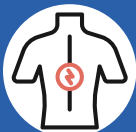
آلام في الظهر